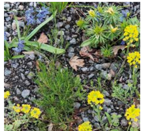
Einen gesunden Lebensraum neu zu erschaffen, braucht ein wenig Zeit. Aus Pflänzchen werden Pflanzen. Wir erleben, dass die Natur unser Bestreben gut annimmt und freuen uns über jede Blüte.