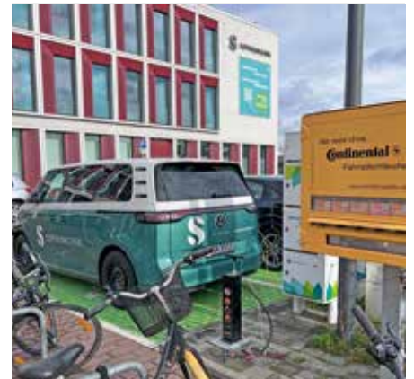
„Mobility-Corner“ an der SOPHIE: Elektrofahrzeug der Klinik, öffentliche E-Ladesäule für Fahrzeuge, Radservice-Station mit Schlauchautomaten und notwendigem Werkzeug, Luftstation und E-Bike-Akku-Ladesäule